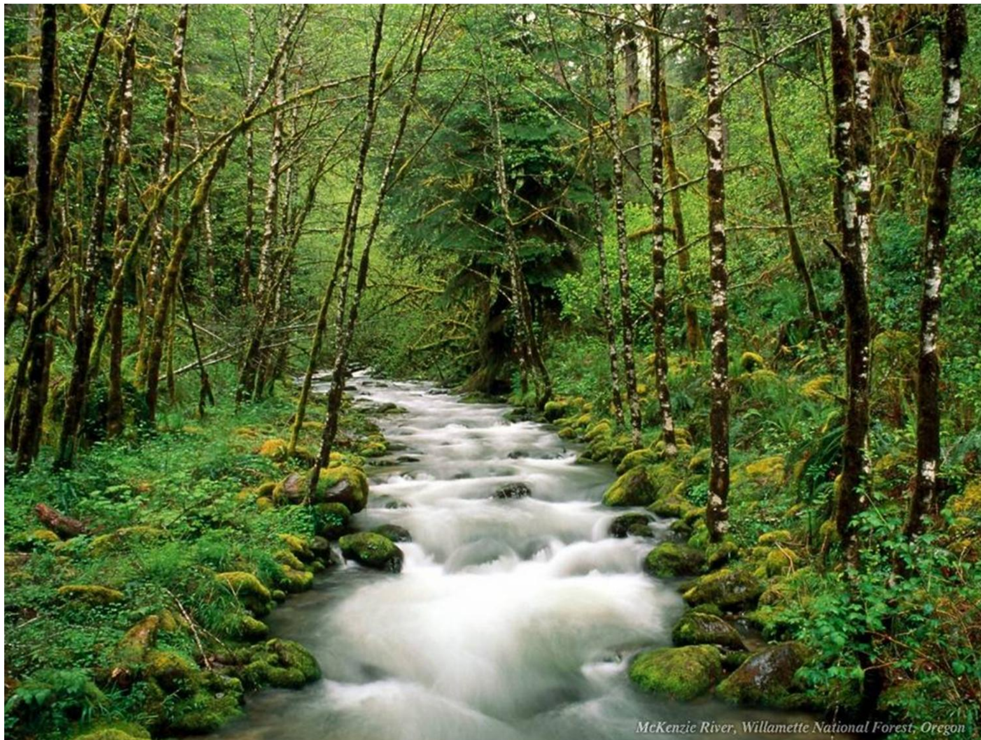
McKenzie River, Willamette National Forest, Oregon